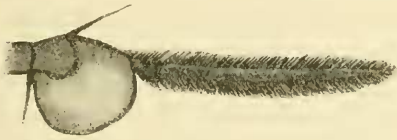
Fig. 1. Innenseite eines Fühlers von Chilosia atriseta n. sp.

Das Tier ist schwarz mit grauweißer, im ganzen kurzer Behaarung; rot ist nur das dritte Fühlerglied. Die Fühlerborste ist zu